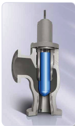
Vanne Fisher type 461

Une bonne étanchéité au clapet / siège est une autre caractéristique importante des vannes utilisées pour les applications de dégazage. Toute fuite entre le clapet et le siège générera un dégazage et endommagera rapidement les surfaces du siège. Dans les conceptions à pression par étage décrites ci-dessus, le niveau d'étranglement classe V est standard et toute fuite éventuelle à travers le clapet / siège se fera vitesse réduite.