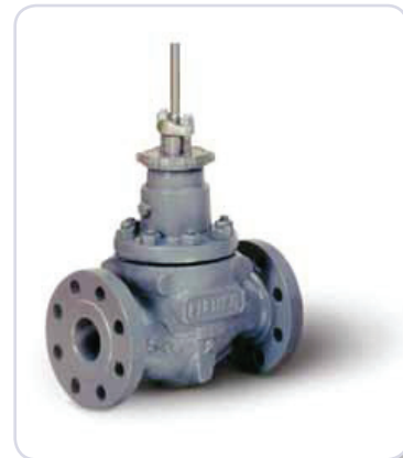
vannes Fisher type EW