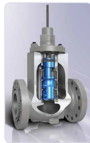
Vanne Fisher type NotchFlo™