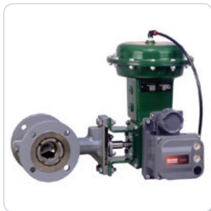
vannes Fisher type V500