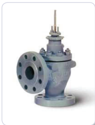
Vannes d'angle Fisher EA

Quel est le type de vanne le plus parfaitement adapté à votre application ? Les vannes d'angle avec écoulement vers l'aval sont la solution la plus courante et la meilleure dans le domaine des applications de vaporisation. La vanne Fisher type V500 est recommandée pour les installations dans lesquelles les vannes d'angle ne peuvent être installées en raison de problème d'isométrie du piping. La vanne Fisher type EW est la solution idéale pour des chutes de pression inférieures à 400 psig (28 bars). La classe d'étanchéité V est recommandée pour les applications de vaporisation. Lorsque la vanne est en position fermée, avec des fuites plus importantes que la classe V, les dommages engendrés par la vaporisation surviendront en aval du siège de la valve, ce qui peut réduire l'espérance de vie de la vanne et influencer sur les opérations d'installation.